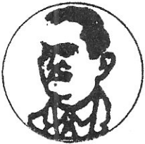
COMISARIADO DEL EJIDO LOS ZAPOTES TALPA DE ALLENDE, JAL.