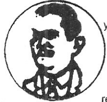
COMISARIADO DEL EJIDO LOS ZAPOTES TALPA DE ALLENDE, JAL.