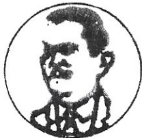
COMISARIADO DEL EJIDO LOS ZAPOTES TALPA DE ALLENDE, JAL.