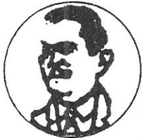
COMISARIADO DEL EJIDO LOS ZAPOTES TALPA DE ALLENDE, JAL.