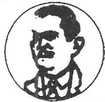
COMISARIADO DEL EJIDO LOS ZAPOTES TALPA DE ALLENDE, JAL.