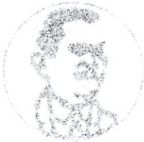
COMISARIADO DEL EJIDO LOS ZAPOTES TALPA DE ALLENDE, JAL.