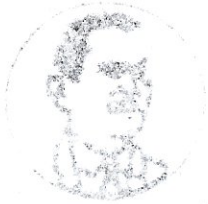
COMISARIADO DEL EJIDO LOS ZAPOTES TALPA DE ALLENDE, JAL.