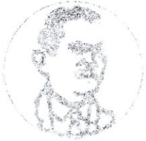
COMISARIADO DEL EJIDO LOS ZAPOTES TALPA DE ALLENDE, JAL.