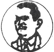
COMISARIADO DEL EJIDO LOS ZAPOTES TALPA DE ALLENDE, JAL.

3.2 Firman este convenio de manera voluntaria, libre y responsable, sin que al efecto exista dolo, lesión, error o algún vicio de la voluntad que lo invalide.